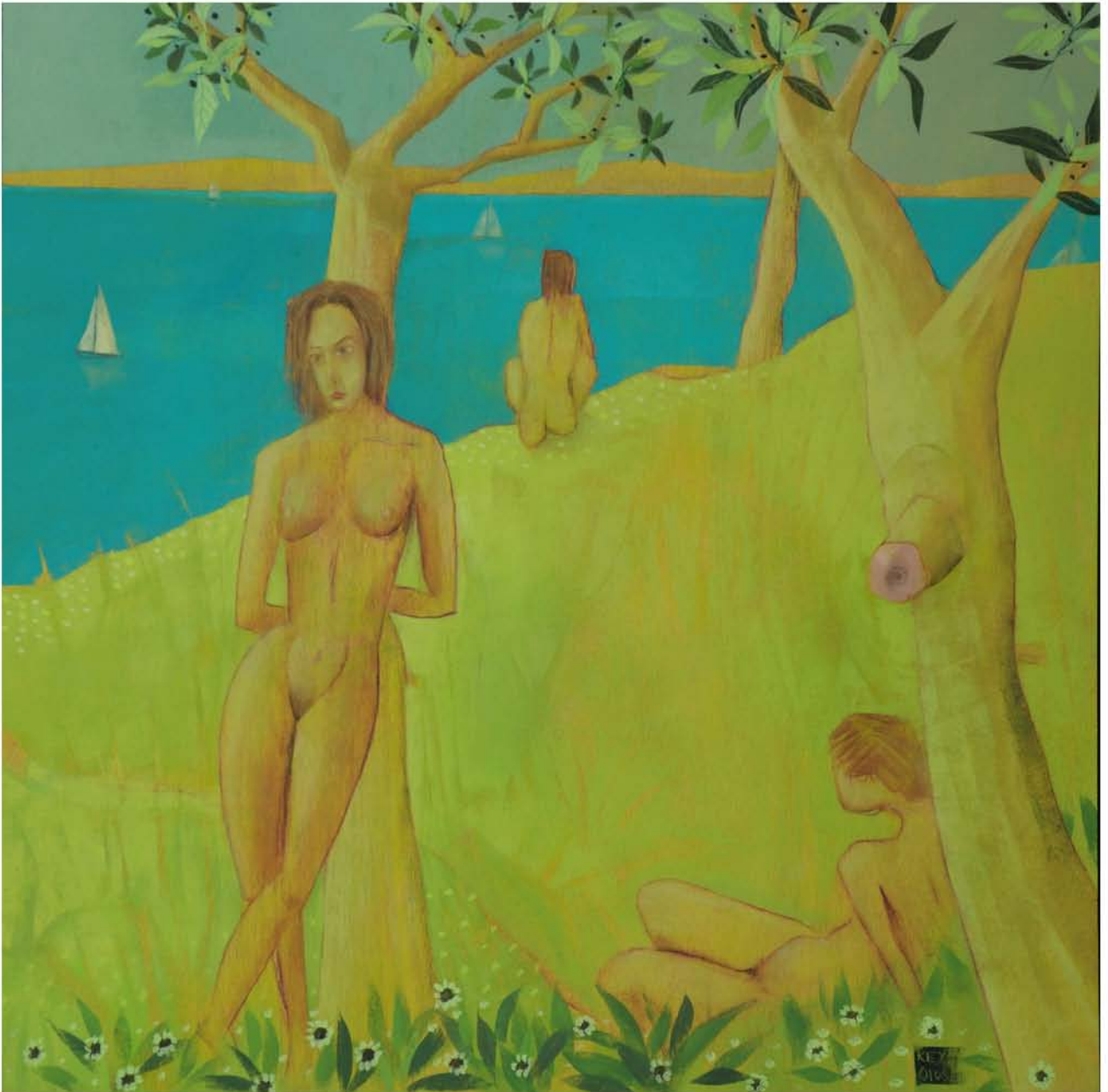
" ... les pains benis ioniennes "