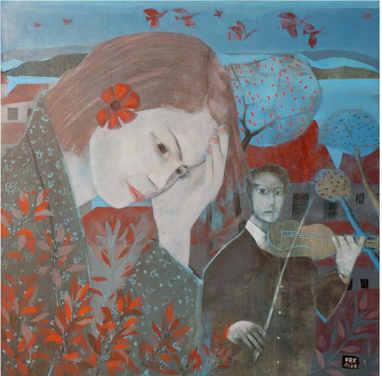
" ... l'amour sans lune "